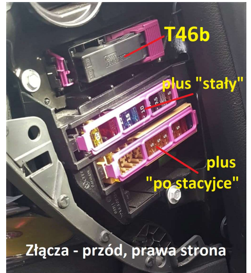
Złącza - przód, prawa strona

B - Złącze 12-stykowe (T12ac), kolor niebieski